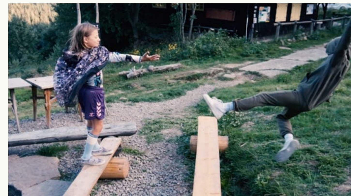
kadry z filmu Super Frania i zatruwacze jagódek . Do obejrzenia na: vimeo.com/740471798